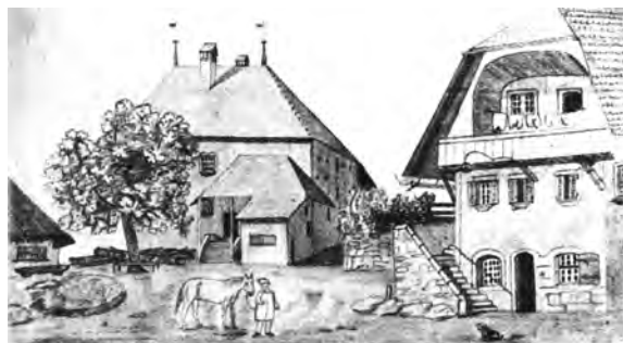
Das Rathaus von Anet vor 1848