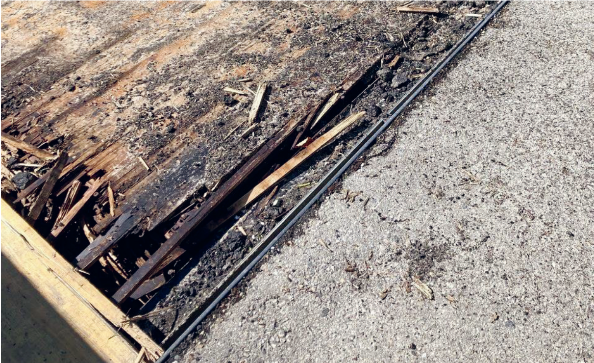
Feuchtigkeitsschäden am Holz der Brückenkonstruktion