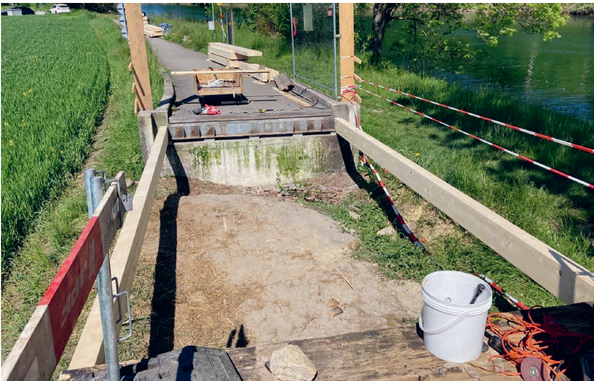
Stark beschädigte Bereiche der Brückenplatte mussten im Zuge der Sanierung vollständig erneuert werden