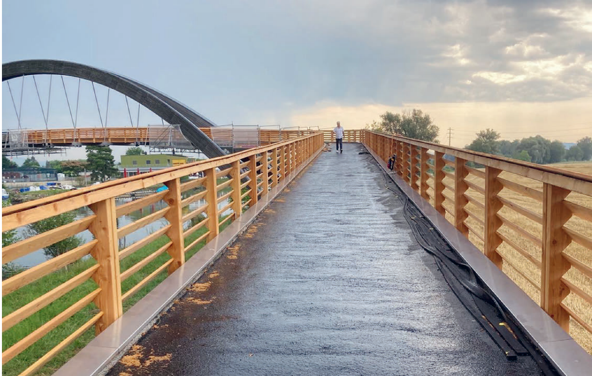
Die vollständig erneuerte Brückenplatte während den Abschlussarbeiten.

Dritte haben die Sanierung mit Beiträgen von insgesamt CHF 125'000.-- unterstützt, damit reduzieren sich die Nettokosten für die Gemeinden Mont-Vully und Ins auf je CHF 384'767.--.