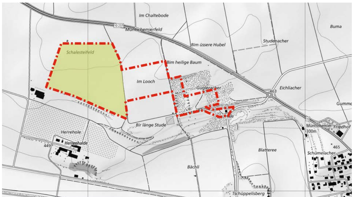
Abbildung 1: Übersicht Kiesgrube Müntschemier, rot: UeO-Perimeter, gelbe Fläche: Erweiterung Kiesabbau, Festsetzung gemäss kantonalem Richtplan